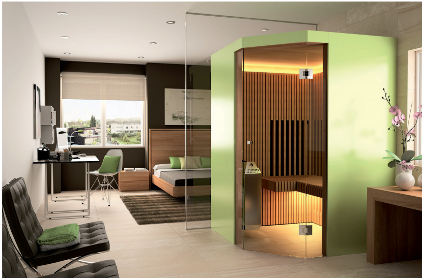
Infracflex® Trias findet als Ecksauna mit nur rund 2m 2 fast überall Platz und bietet auf kleinstem Raum drei verschiedene Saunaarten.